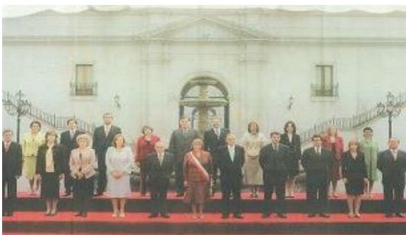
© Erschienen im Magazin der Frankfurter Rundschau, 28. Oktober 2006

Die Antwort auf die zweite Leitfrage „Wo wollen wir hin?“ gibt das Foto des chilenischen Regierungskabinetts mit der Präsidentin Michelle Bachelet vom Oktober 2006.