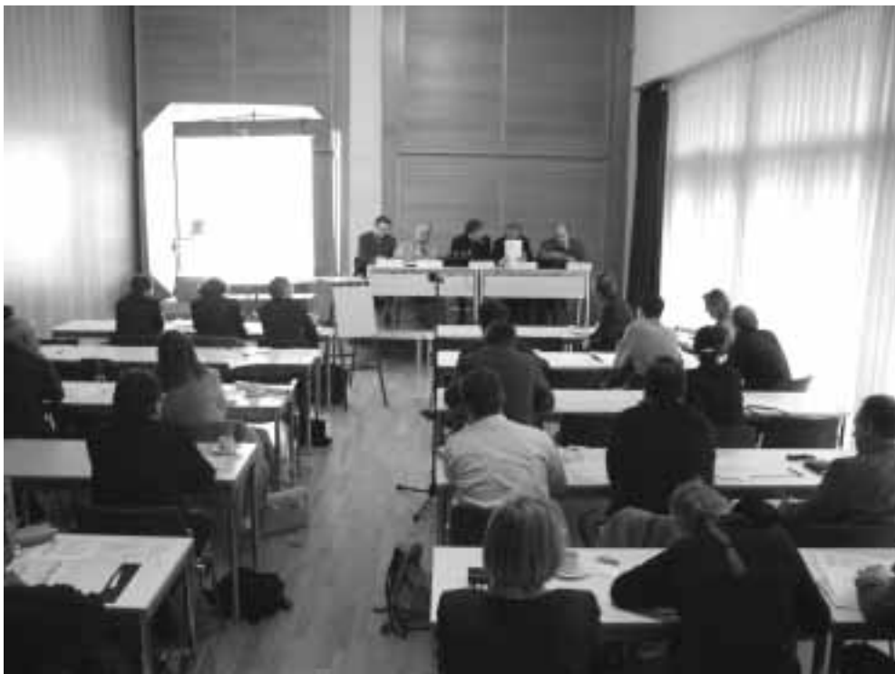
VENRO-Fachtagung zur Zwischenbilanz der Umsetzung des „Monterrey Konsensus“ am 19. November 2003 in Berlin