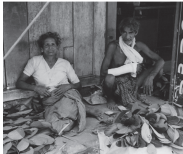
StraßenhändlerInnen im ländlichen Kerala (Indien)

worden. Nämlich das Entwicklungsparadigma, welches auf die Überlegenheit marktwirtschaftlicher Ressourcenallokation setzt und die entwicklungshemmende Fehlregulierung des Staates betont. Auch der »Monterrey Konsens« bietet keinen neuen Konsens an, die Probleme ausreichender Kapitalakkumulation und Wachstum anzugehen. Und die Erfahrungen nach fünf Jahren PRSP zeigen, dass Länder zwar größere Spielräume hinsichtlich der Ausgestaltung und Zielsetzung sozialer Ausgabenprogramme und Sicherheitsnetze haben, aber nicht bei der Frage makroökonomischer Politik und der Wahl von Entwicklungsstrategien (UNCTAD 2006: 51).