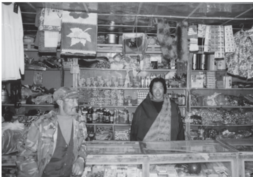
Ladenbesitzer in An Qu auf dem tibetischen Hochplateau (China)

In der internationalen Debatte wird hier u.a. auch der Peer Review-Mechanismus vorgeschlagen. Die politische Praxis von Regierungen bei Fragen der Finanzierung, soll von anderen, befreundeten Regierungen bewertet wer-