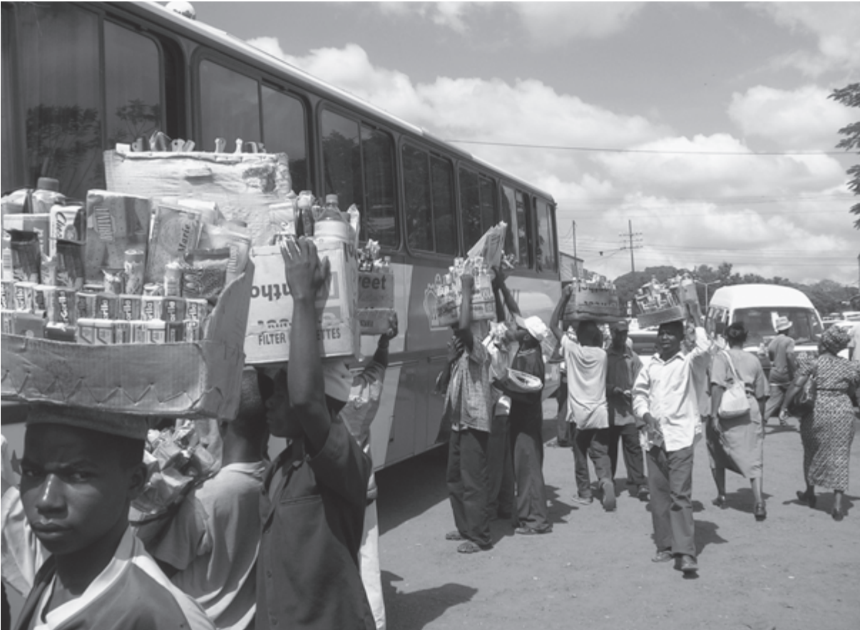
Fliegende Händler an einem Bus der Linie Arusha-Daressalam (Tansania)

die individuellen Probleme des Landes zielten und somit effektiver zur Entwicklung beitragen könnten.