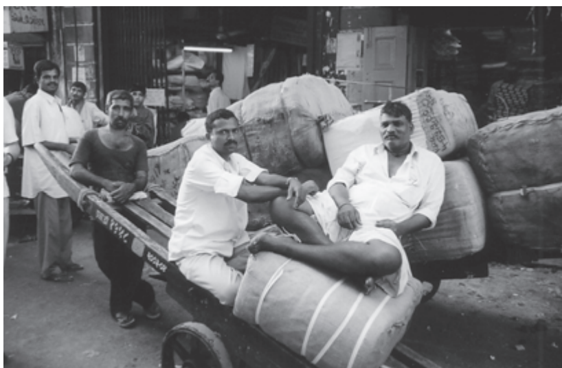
Lastenträger auf einem Markt in Mumbai (Indien)

Durchsetzung der Handelsliberalisierung als dominantes Regulierungsprinzip der Weltwirtschaft. Die BWI kooperieren seitdem umfassend mit der WTO. Ihre besondere Rolle wurde von Beginn der Zusammenarbeit an vor allem darin gesehen, Handelsliberalisierung im Rahmen eines weitergehenden Maßnahmenpakets einzubetten, um die notwendigen komplementären Reformen zur Liberalisierungagenda der WTO in Entwicklungsländern durchzusetzen.